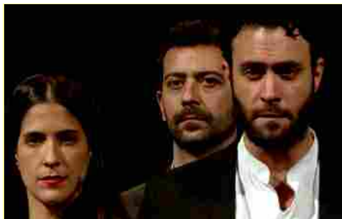
Un'immagine di "Dieci storie proprio così"

"Dieci storie proprio così", documentario diretto da Emanuela Giordano e Giulia Minoli nasce da uno spettacolo teatrale e racconta le storie di italiani che da nord a sud si sono battuti nella lotta contro la criminalità organizzata. Questo film testimonia l'impegno di chi non vuole abbassare la testa e non si arrende davanti alla mafia, un nemico forte, permeato fin troppo bene nelle nostre comunità.