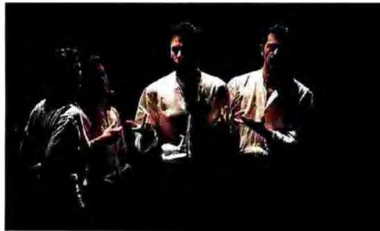
Tra finzione e realtà. Una scena del docu