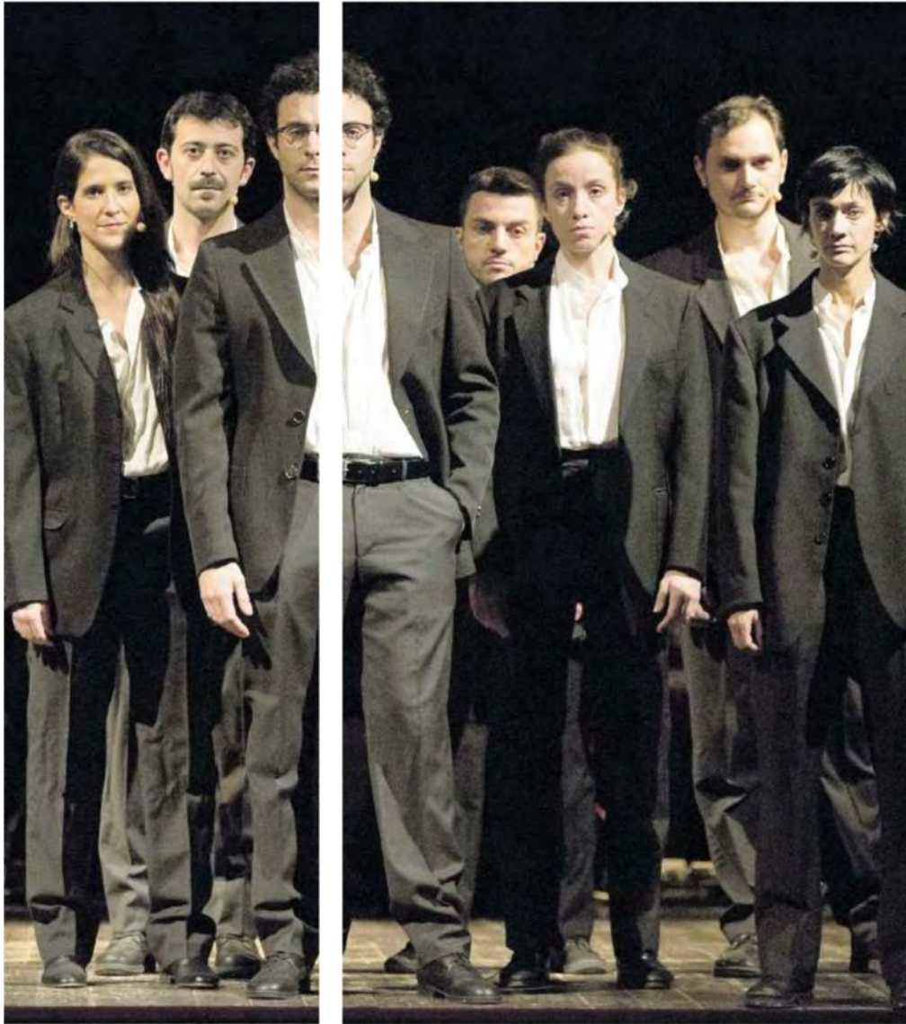
DIECI STORIE PROPRIO COSÌ Gli attori dello spettacolo all'Argentina. In basso, due momenti del documentario: il Gazometro e la festa per Addiopizzo